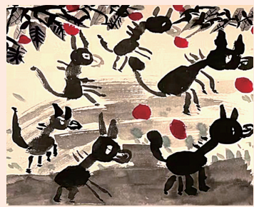
归 德化县特殊教育学校 曾庆镇 指导教师 苏桂玲