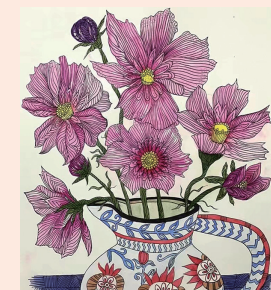
花瓶里的春天 德化县双鱼幼儿园 梁佳潼 指导教师 李丽煌